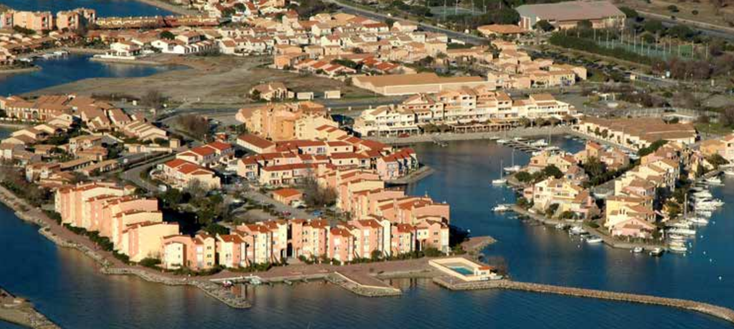
← Vue du port aujourd'hui