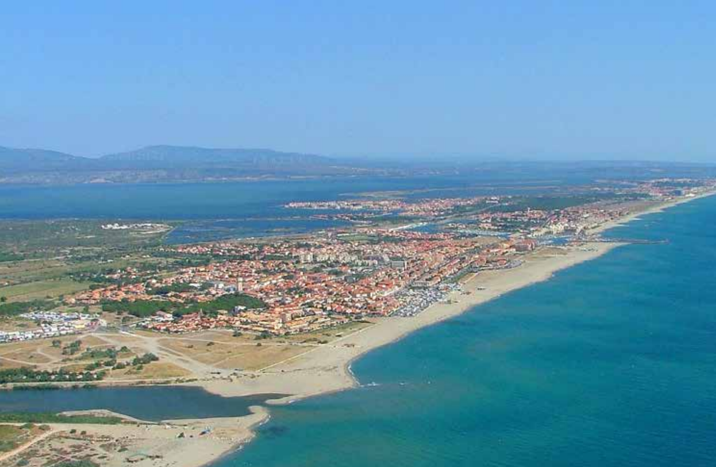
← Vue aérienne sur la baie du Barcarès