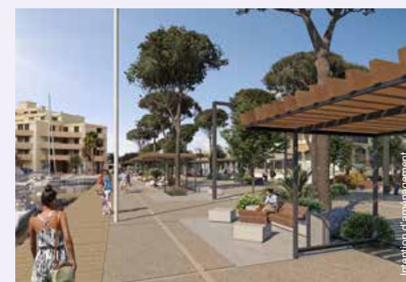
↑ L'aménagement du quai Gerbault: la première opération du projet